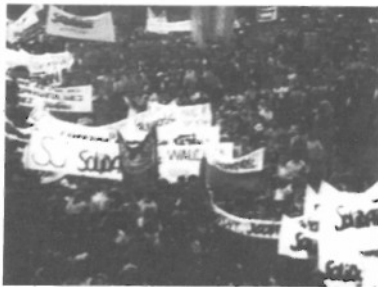
Rachuby na spacyfikowanie społeczeństwa przez papieża zawiody.