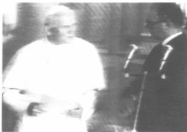
Jan Paweł II, gen. Jaruzelski: Dystans między władzą a Kościołem jest tym samym dystansem, jaki dzieli tę władzę od społeczeństwa.

Jest sprawą oczywistą, że w długofalowej polityce Watykanu leży zbliżenie z Sowietami, próba „normalizacji” stosunków z Europą Wschodnią. Od dawna też ten kierunek polityki wschodniej Stolicy Apostolskiej budzi żywe obawy. Nie darmo Józef Mackiewicz, jeden z najbardziej bystrych obserwatorów areny polityki europejskiej poświęcił tej sprawie książkę „Watykan w cieniu czerwonej gwiazdy”. Jest rzeczą oczywistą, że w tych obawach sporą rolę odgrywa tradycja Kościoła nakazująca w zasadzie dystansowanie się wobec wydarzeń aktualnych, nastawiona na cele długofalowe. Jako kontynuację tej też tradycji część obserwatorów pragnęła widzieć obec-