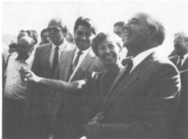
M. Gorbaczow z żoną Raisa: Dobrze skrojone garnitury i zakupy u Cartiera.

czy też stwarzanie wygodnych dlań politycznych faktów dokonanych dlatego cieszą się taką popularnością, iż społeczeństwa zachodnie odbierają je przede wszystkim w opozycji do wcześniejszej, nasyconej twardą, antykomunistyczną retoryką polityki prezydenta Reagana. Dla znacznej części antyamerykańsko nastawionej opinii publicznej na Zachodzie jest to okoliczność nie bez znaczenia. W państwach satelickich z kolei „siła przebiecia” Gorbaczowa bierze się stąd, że ich społeczeństwa w „głasności” i „pieriestrojce” widzą nadzieję na poprawę warunków życia.