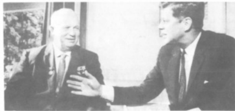
N. Chruszczow (z lewej), J. F. Kennedy: Przez dwadzieścia lat po wojnie doktryna Trumana była przez USA przestrzegana.

Pod koniec lutego 1947 roku rząd brytyjski, w dwóch formalnych notach dyplomatycznych poinformował ówczesnego sekretarza stanu Georga Marshalla, że Wielka Brytania nie jest już dłużej w stanie udzielać pomocy wojskowej Grecji, gdzie legalny rząd zagrożony był komunistycznym powstaniem i Turcji, która musiała na gwałt zbroić się, gdyż Stalin żądał od niej ustępstw terytorialnych,