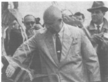
N. Chruszczow: „Odwilż” poszła za daleko.

Celem Gorbaczowa jest unowocześnienie państwa. Czy należy się z tego cieszyć czy nie, zależy to przede wszystkim od... samego Gorbaczowa, a ściślej od powodzenia i trwałości przeprowadzanych przez niego zmian. Albo więc reformy „przejdą” i Związek Sowiecki stanie się państwem nowoczesnym par excellence, tzn. dorównującym krajom zachodnim nie tylko poziomem gospodarczym czy militarnym, lecz również organizacją życia społecznego wzorowanego