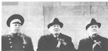
(Od lewej) Ustinow, Czernienko, Tichonow: Konflikt pokoleń był nieunikniony.

władzy nosi wyraźnie piętno konfliktu pokoleniowego. Pierwsze jego objawy wystąpiły po śmierci Breżniewa, próbą powstrzymania erupcji był wybór na stanowisko sekretarza generalnego KPZS Andropowa, a w okresie rządów Czernienki nikt już nie krył, że zmiana warty w sowieckim aparacie władzy, obejmująca również partyjnorządowe kierownictwo, zbliża się nieuchronnie i że niebawem proces ten osiągnie swój punkt krytyczny. Wszyscy jednocześnie zdawali sobie sprawę, iż nie będzie on przebiegał „bezkrwawo”. System władzy sowieckiej jest bowiem obwodem zamkniętym, w którym wszelki ruch wewnętrzny poddany jest działaniu i kontroli nomenklatury. Nomenklatura zaś jest w Związku Sowieckim najważniejszym narzędziem sprawowania władzy i do tego, kto nad nią panuje, władza ta należy.