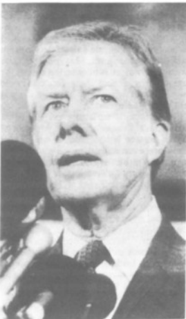
J. Carter: Żywotne interesy USA tylko w rejonie Zatoki Perskiej.

Neozolacjonistyczne nastawienie zwykłych Amerykanów jest zwiokrotnione przez kłopoty materialne, tak w skali rodziny, jak i kraju. W ciągu ostatnich 15 lat dochody realne rodzin amerykańskich spadły o 7,3%, natomiast trzykrotnie wzrosło zadłużenie z tytułu zakupów na raty. O ile ćwierć wieku temu na kupno i spłatę domu rodzina amerykańska wydawała 1/4 swoich dochodów, to teraz, mimo iż znacznie zwiększyła się ilość rodzin w których pracuje i mąż i żona, wydatki na dom sięgają już prawie połowy dochodów. W tej sytuacji politycy Partii Demokratycznej wiedzą, że zyskają poparcie lub choćby przyzwolenie wyborców, gdy obetną budżet wojskowy, a przede wszystkim budżet polityki zagranicznej. I tak w ciągu ostatnich dwu lat wydatki na pomoc zagraniczną, działalność Departamentu Stanu, funkcjonowanie aparatu propagandy zagranicznej oraz wymianę kulturalną i naukową z zagranicą obcięto o przeszło 20%.