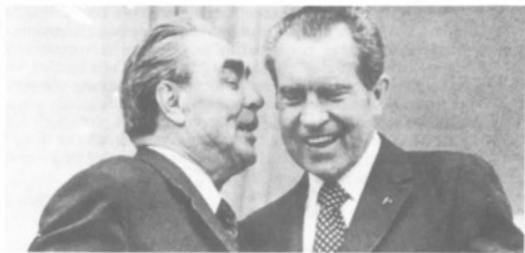
L. Breżniew (z lewej), R. Nixon: Przeciwno komunizmowi jedynie wsparcie polityczne i materialne.

Ronald Reagan, który został wybrany prezydentem pod hasłem przywrócenia Ameryce dumy i godności oraz odwrócenia fali postępów komunizmu, sformułował z kolei „doktrynę Reagana”. Stanowi ona jakby odwrócenie „doktryny Nixona”. Gdy tamta przewidywała udzielanie materialnej pomocy niekomunistycznym rządów walczącym z komunistyczną partyzantką, ta przykazuje udzielanie pomocy antykomunistycznym partyzantom walczącym z rządami uznawanymi przez Waszyngton za komunistyczne. Tak więc posyłana jest broń dla afgańskich Mudzaheddinów, choć jednocześnie pod naciskiem kół farmerskich właśnie Ronald Reagan zniósł częściowe i właściwie dość nieśmiało embargo na dostawy