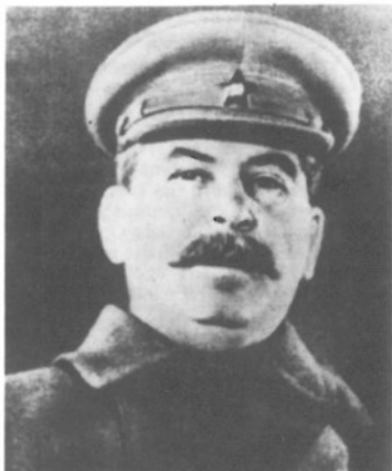
J. Stalin: Telefonował do Pasternaka.

czowowi okazję do zwolnienia z funkcji naj- wyższych rangą dowódców Armii Czerwonej, marszałka obrony ZSSR i dowódcę sił obrony przeciwlotniczej.