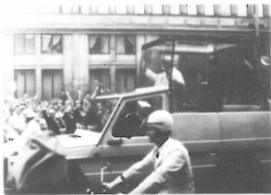
Coraz mniej ręk z znakiem zwycięstwa.

pów zwrócił uwagę na umowę z „Solidarnością Rolników Indywidualnych”, następnie w Szczecinie na podpisane tam w sierpniu 1980 r. porozumienie z Komitetem Strajkowym, na koniec w Gdańsku mówił o słynnym porozumieniu z 31 sierpnia 1980 r. jako programie wciąż aktualnym, bo nie spełnionym. Mówił o niezależnych, samorządnych związkach zawodowych i słowie-idei Solidarność, które wyszło z Gdańska na Polskę i w świat. W warszawskim kościele św. Krzyża Jan Paweł II mówił o tym, że należy utrzymać przestrzeń wolności w Kościele, następnie ukląkł przy grobie zamordowanego przez agentów Służby Bezpieczeństwa księdza Jerzego Popiełuszki, ucałował krzyż nagrobny i pobłogosławił jego rodziców.