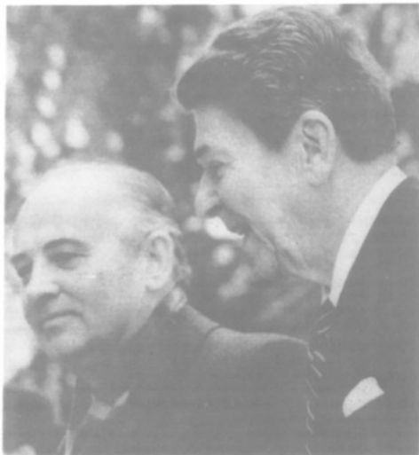
M. Gorbaczow (z lewej), R. Reagan: Porozumienie z Sowietami za wszelką cenę.

Z grubsza biorąc, w ciągu ostatniego ćwierćwiecza pierwszy trend był wyraźny wśród amerykańskich Republikanów, drugi wśród Demokratów. Ale, jak już pisałem, najpowszechniejsze jest schizofreniczne pomieszanie obu postaw. Przekonanie liberalne, że Ameryka winna nieść kaganek oświaty i demokracji łączy się bowiem często z pogardą wobec Rosjan („te muzyki nie są przecież w stanie nam zagrozić, skoro nie potrafili zbudować nawet przyzwoitego samochodu”) i jest oczywiście skrzętnie ukrywane. Do tego dochodzi częste po obu stronach przekonanie, że dla narodów już zagarniętych uściskiem sowieckiego niedźwiedzia nic się nie da zrobić, wobec czego liberałowie lansują tezę, że należy, kierując się pragmatyzmem, walczyć o swobody demokratyczne tam, gdzie panują dyktatury prawicowe, jak w Południowej Afryce czy Chile, zaś konserwatyści zastanawiają się, jak nie utracić Europy Zachodniej, skoro Wschodnia jest już i tak stracona.